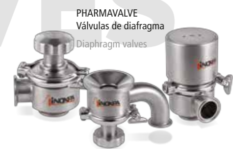
PHARMAVALVE Válvulas de diafragma Diaphragm valves