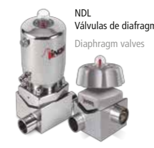
NDL Válvulas de diafragma Diaphragm valves