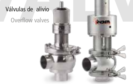
Válvulas de alivio Overflow valves