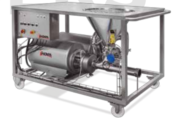
Mezclador horizontal de mesa Horizontal table blender