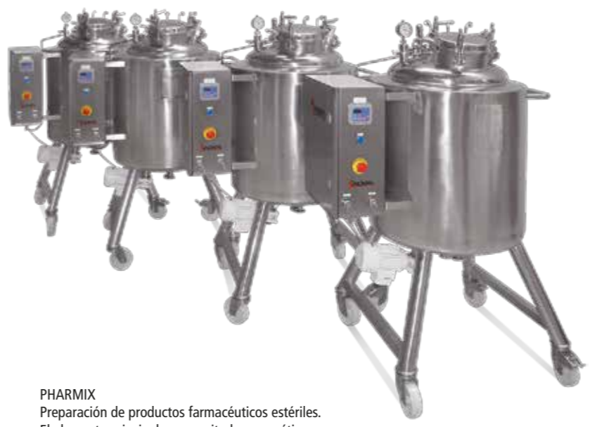
PHARMIX Preparación de productos farmacéuticos estériles. El elemento principal es un agitador magnético Preparation of sterile pharmaceutical products. The main element is a magnetic agitator