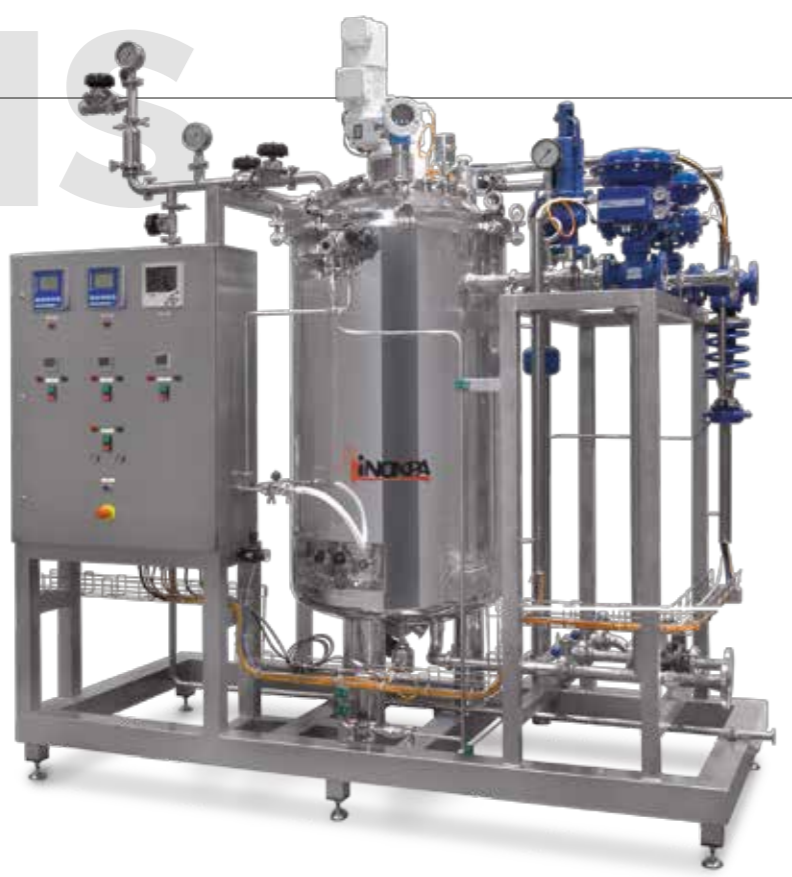
Reactores para preparación de soluciones inyectables. Incluye instrumentación, agitador, cuadro eléctrico y de control y videoregistrador Reactors for preparation of solutions for injections. Includes: instrumentation, agitator, control panel and video recorder