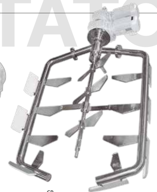
CR Agitador contra-rotación Counter-rotating agitator