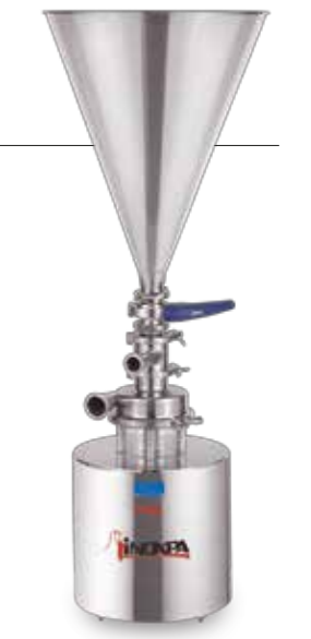
M-226 Mezclador sólido-líquido Solid-liquid blender