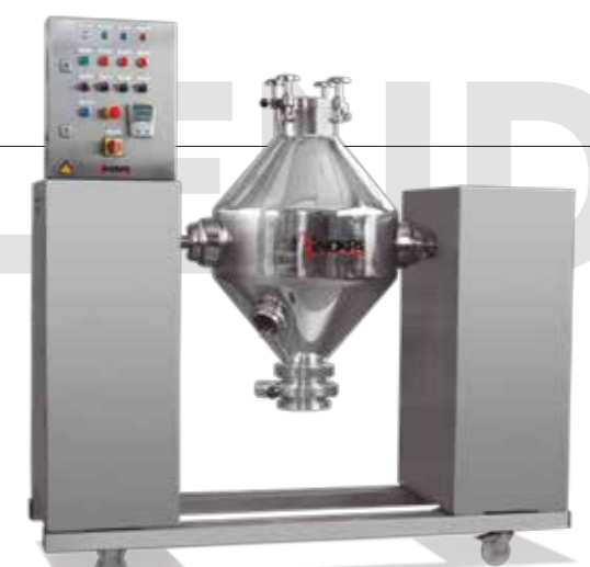
MBC Mezclador tipo bicónico Equipo para la realización de mezcla homogénea de sólidos Double cone solids blender Skid designed to produce homogeneous solid-solid mixture