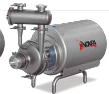
Prolac HCP-SP Bomba autoaspirante Self-priming pump