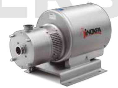
ME-4100 Mixer en línea In-line mixer