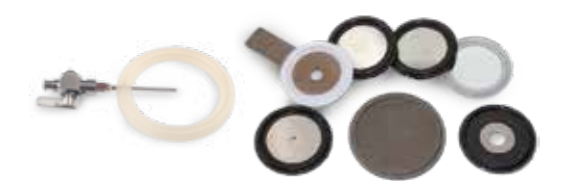
Juntas para uso farmacéutico. Certificadas FDA y USP. Clase VI-XXII Pharmaceutical gaskets. FDA and USP certified. Class VI-XXII certification