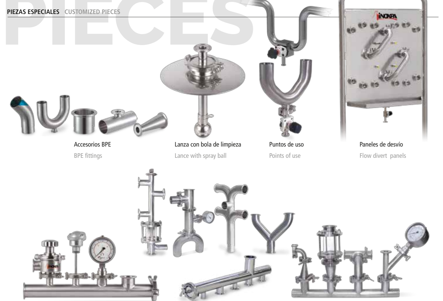
Accesorios BPE BPE fittings Lanza con bola de limpieza Lance with spray ball Puntos de uso Points of use Panels de desvío Flow divert panels Colectores y piezas especiales Collectors and customized pieces