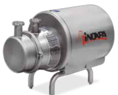
Aspir Bomba autoaspirante Self-priming pump