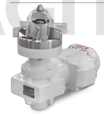
Agitador magnético BMA Magnetic agitator BMA