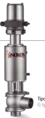
Tipo G G type