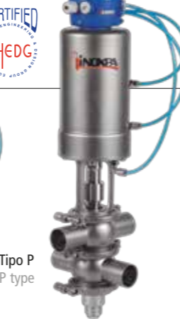
Tipo P P type