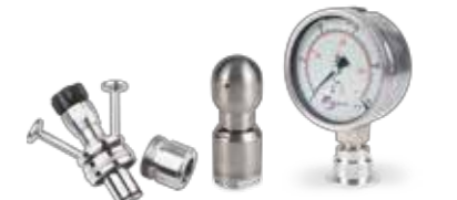
Grifos tomanuestras asepticos, bolas de limpieza y manómetros Aseptic sampling valves, spray balls and pressure gauges