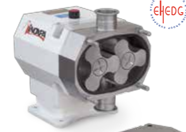
HLR Bomba lobular Rotary lobe pump