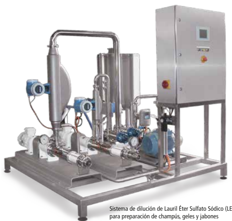
Sistema de dilución de Lauril Éter Sulfato Sódico (LESS) al 26% para preparación de champús, geles y jabones Dilution system of Sodium Laureth Sulfate (SLES) to 26% for preparation of shampoos, gels and soaps