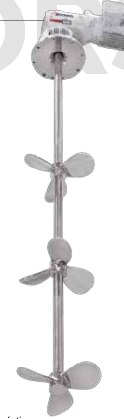
Agitador aséptico con hélices marina Aseptic agitator with marine propeller