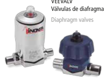
VEEVALV Válvulas de diafragma Diaphragm valves