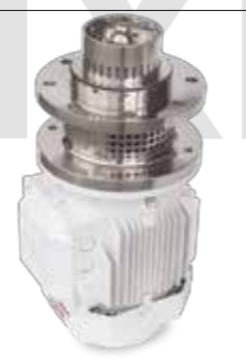
ME-6100 Mixer de fondo Tank bottom mixer