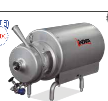
Prolac HCP-WFI Bomba centrífuga Centrifugal pump