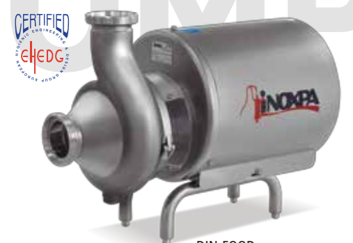
DIN-FOOD Bomba centrífuga Centrifugal pump