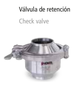
Válvula de retención Check valve