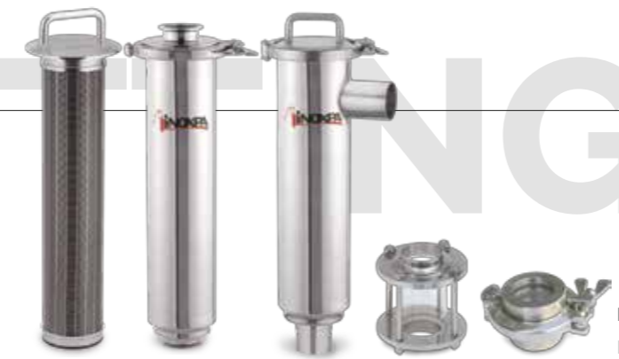
Filtros y mirillas Filters and sight glasses