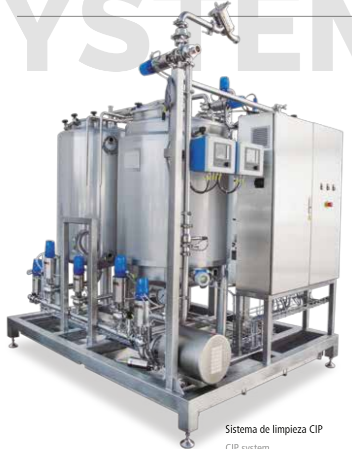
Sistema de limpieza CIP CIP system