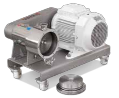
ME-8100X Mixer multidientes Multitooth mixer