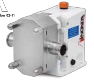
SLR Bomba lobular Rotary lobe pump