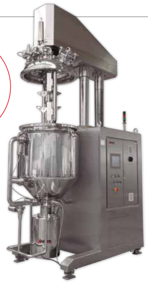
Skid with counter-rotating agitator and mixer. Preparation of highly viscous products at a controlled temperature and pressure