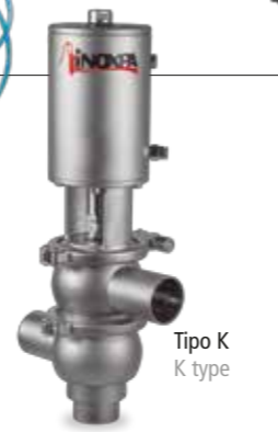
Tipo K K type